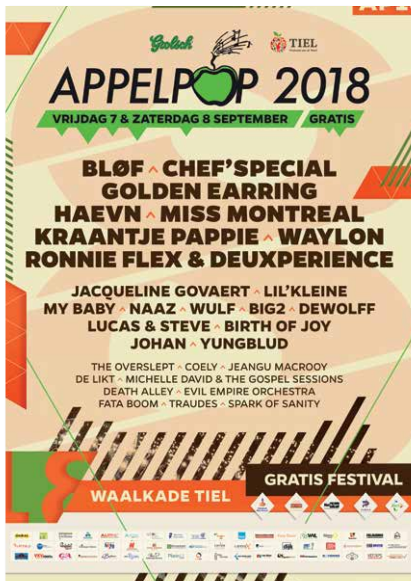
Full-colour poster Appelpop 2018

In 2019 worden Partners en Hoofdsponsors A vermeld op de poster.